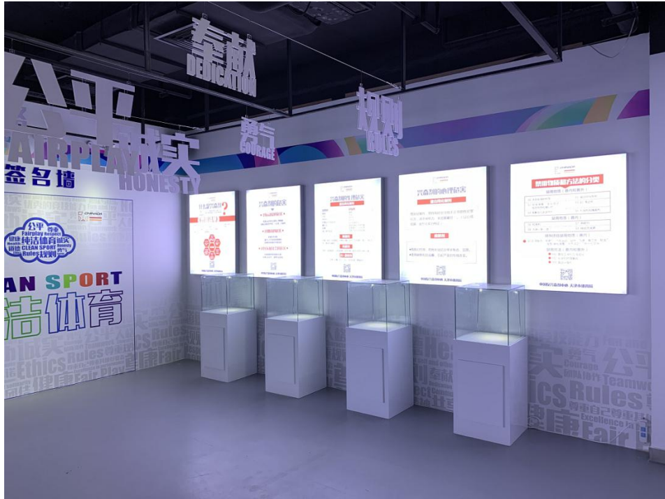
7. 反兴奋剂主题标志圆筒