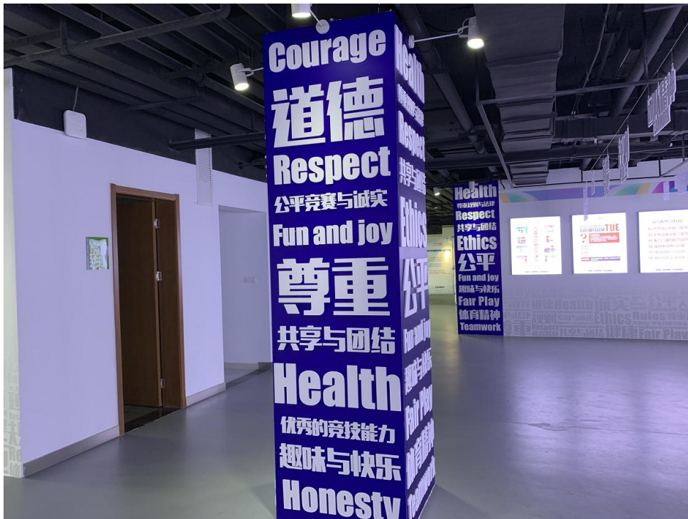
6. 反兴奋剂知识灯箱、玻璃展示柜